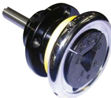
Chucks in flange version