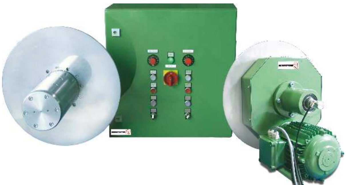
Edge strip winder